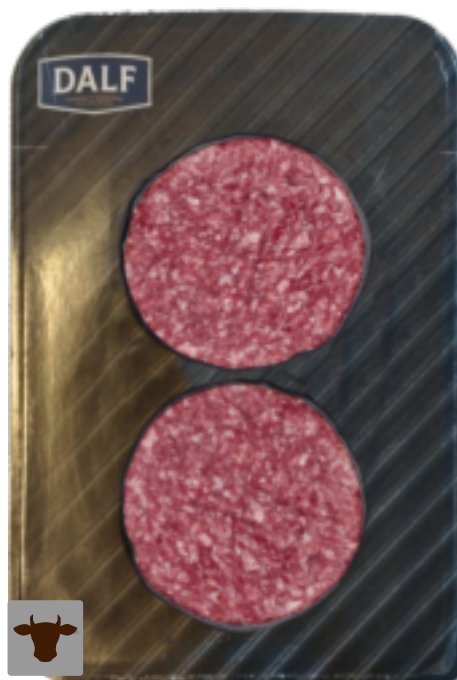
Hamburger di scottona Gr. 100x2 F70087