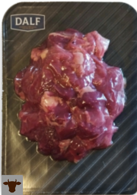
Spezzatino magro bovino Gr. 400 F70106