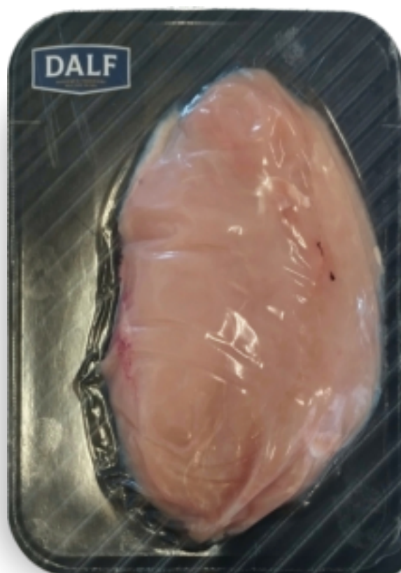
Fesa di tacchino a fette Gr.400 F70136