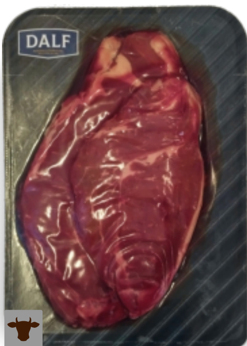
Bistecca di controfiletto Gr. 400 F70100