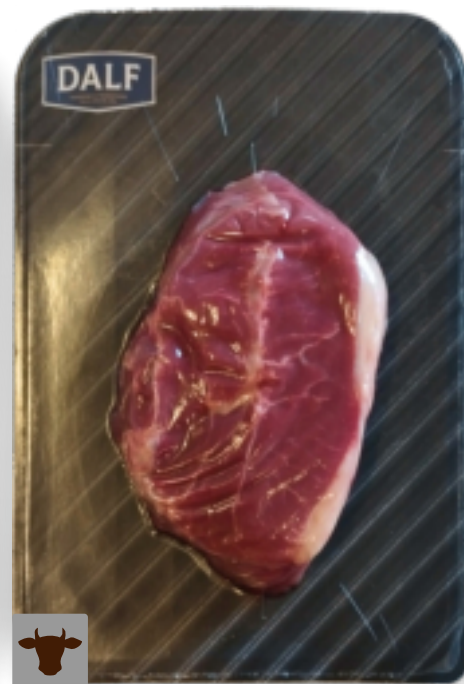
Cappello del prete aletta di spalla Gr. 500 F70108