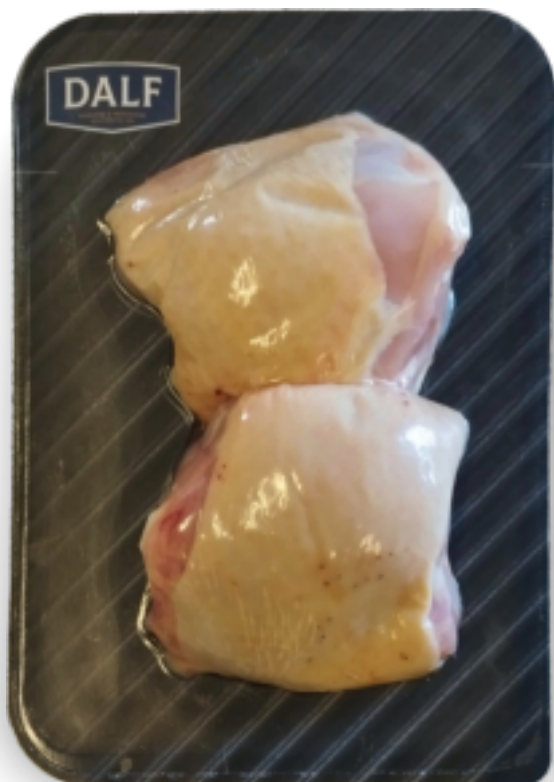
Sovracoscia di pollo x3 Gr.400 F70132