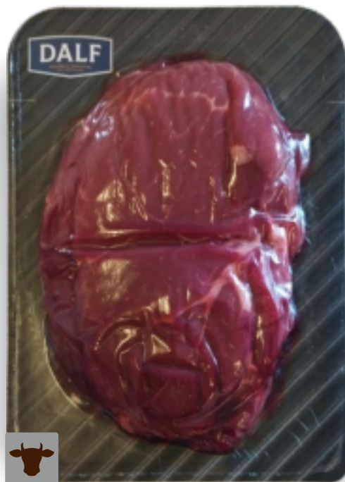
Fette magre di coscia bovina Gr. 400 F70104